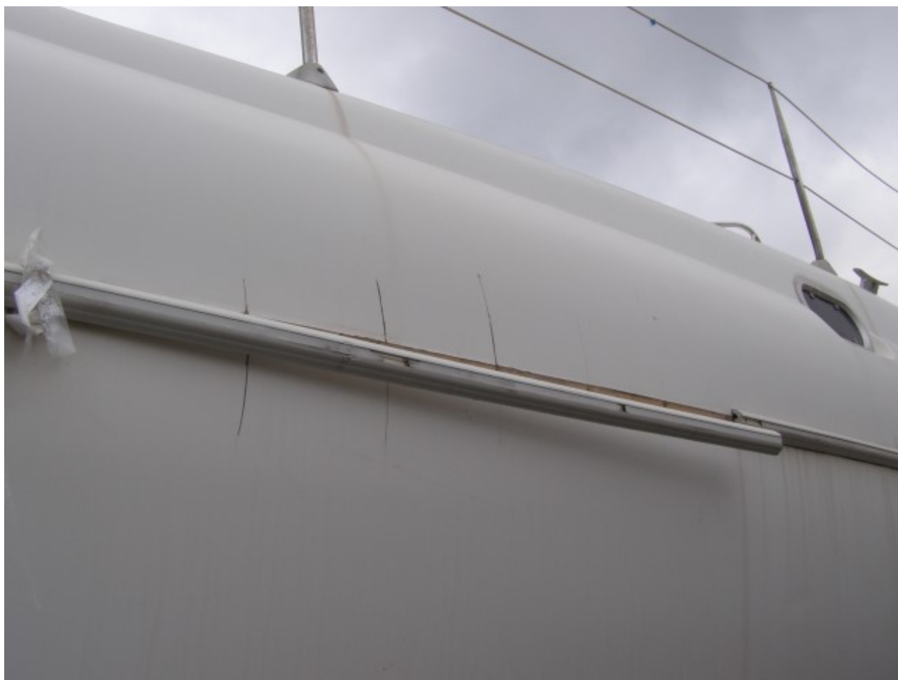
Oštećenja na trupu

tel: 052 – 432 230, fax: 052 – 427 157, GSM: 098 – 366 223 e-mail: info@yacht-pool.com.hr