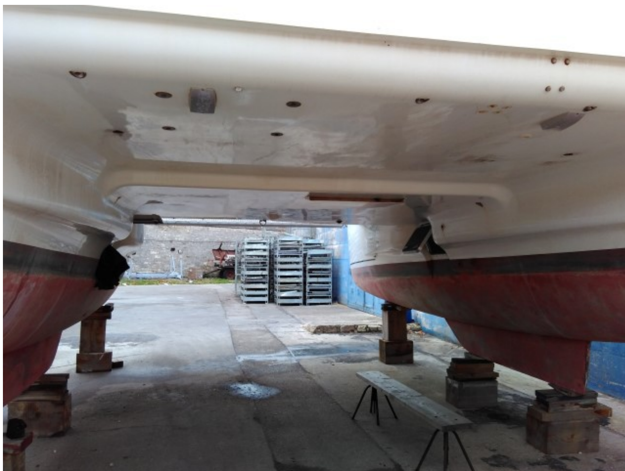
Pogled na podvodni dio plovila

tel: 052 – 432 230, fax: 052 – 427 157, GSM: 098 – 366 223 e-mail: info@yacht-pool.com.hr